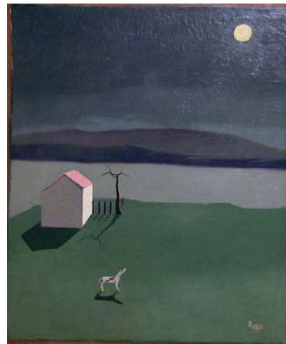
Antonio Quirós: "Perro ladrando a la luna" (1935)